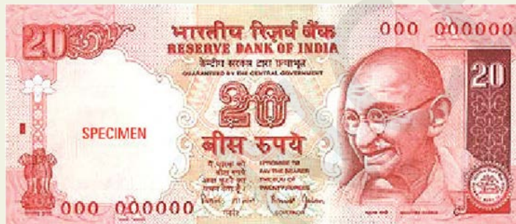
20 रुपये का नोट